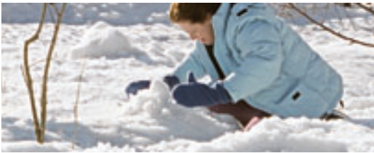
Snow Cake Marc Evans Coproduction United Kingdom . Royaume-Uni