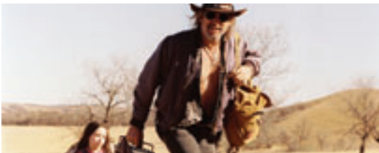
Tideland Terry Gilliam Coproduction United Kingdom . Royaume-Uni