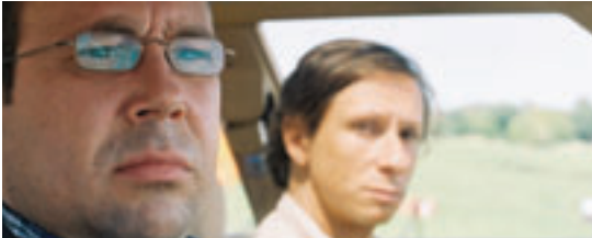
Congorama Philippe Falardeau Coproduction Belgium . Belgique, France