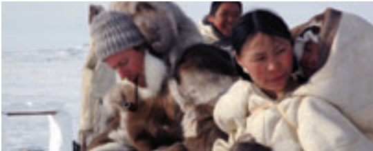
The Journals of Knud Rasmussen Zacharias Kunuk Coproduction Denmark . Danemark